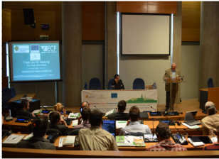
Evenimentele proiectului Traseul "Cortinei de Fier" - conferința intermediară a proiectului Traseul "Cortinei de Fier", Salonic, 3.10.2013